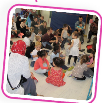
Débattre, se questionner